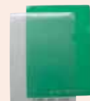
クリアファイル 各50円