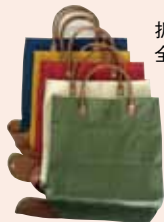
折りたたみトートバック 全5色 各700円