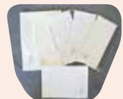
レターセット 100円 一筆箋 各100円