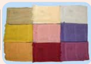
タオルマフラー 各800円